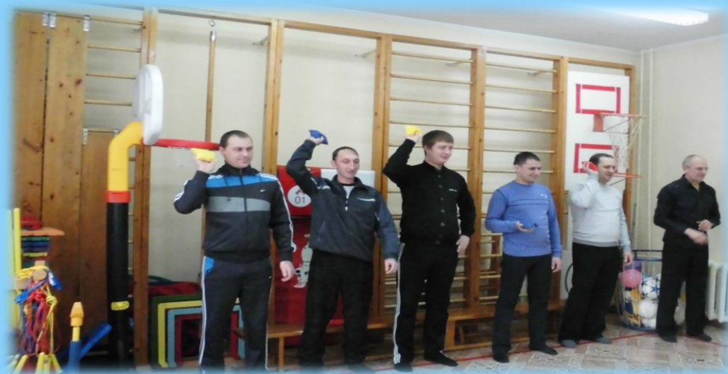
«Кто дальше кинет»