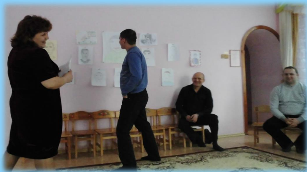
«Угадай свой портрет»