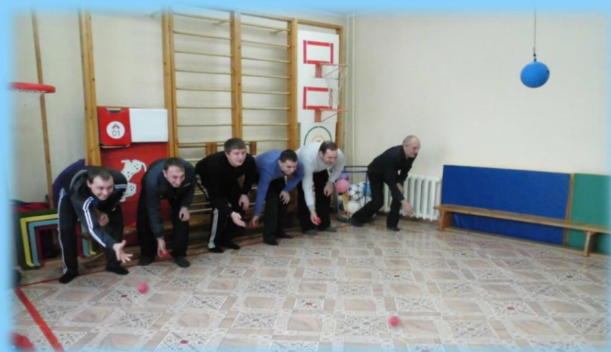
«Попади в цель»