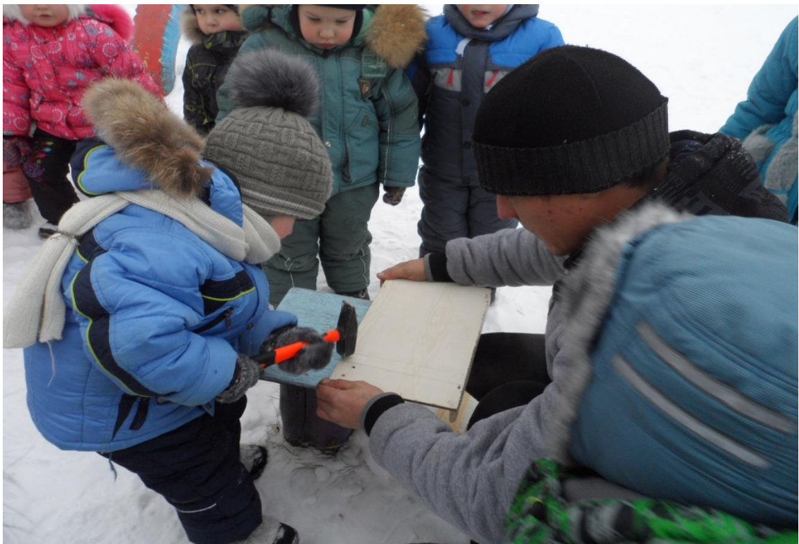
«Изготовление кормушки для птиц»