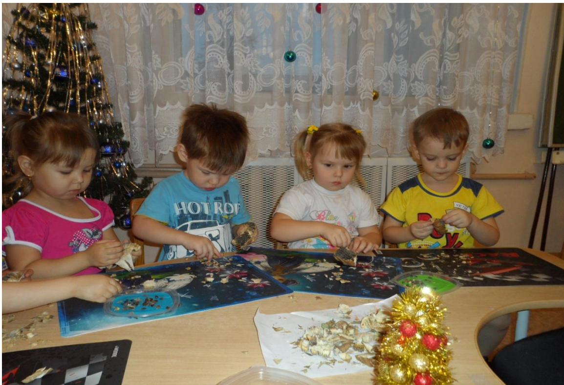
«Заготовка корма для птичек»(шалушение подсолнуха)