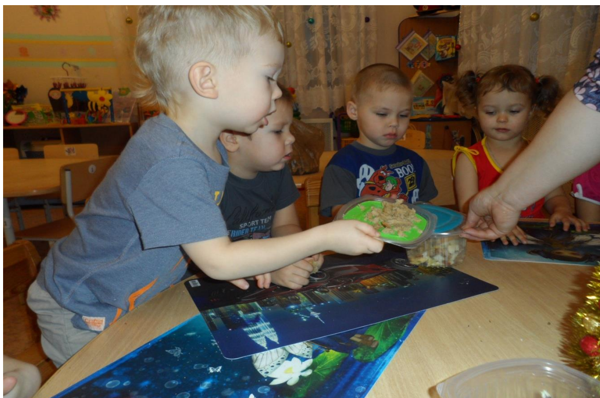
«Заготовка корма для птичек»(из оставшегося хлеба)