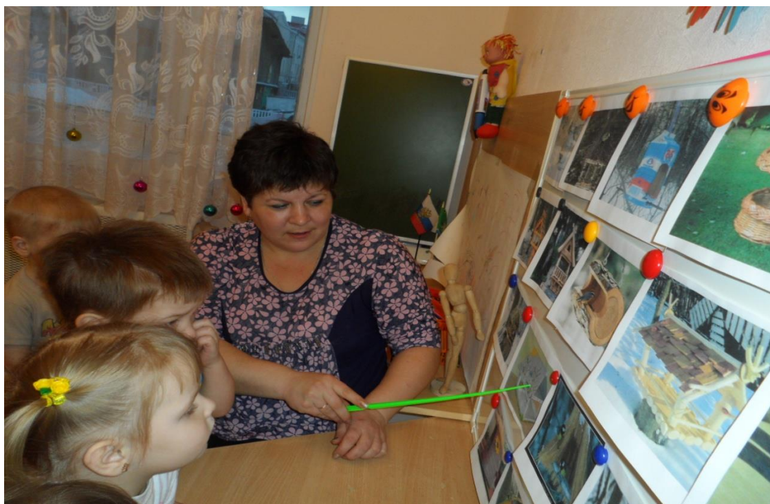
«Беседа о кормушках»